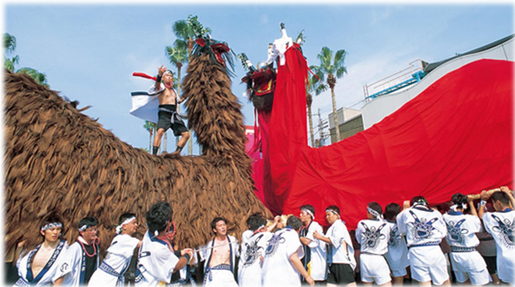
うわじま牛鬼まつり より 『牛鬼』