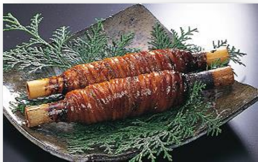
鯛そうめん(上)太刀巻き(下)