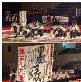
優勝(3連覇) 松本蟻ヶ崎高等学校