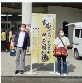
医療ボランティア

今年も医療ボランティアとして書道パフォーマンス甲子園に参加しました。 選手の皆さんのひたむきな姿や、全力を出し切った後の清々しい笑顔に胸を打たれました。